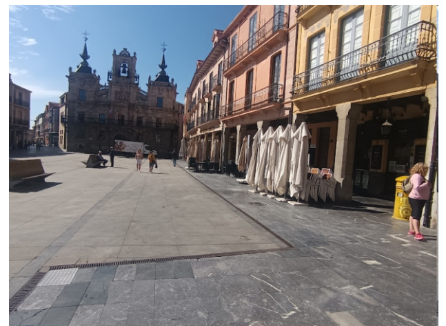
Sillas y sombrillas apiladas en la plaza Mayor ayer